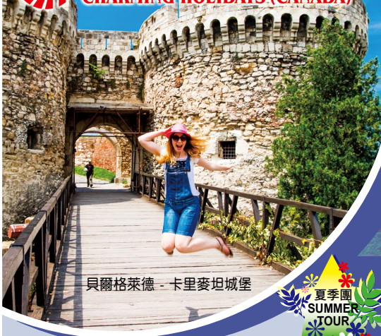
貝爾格萊德 - 卡里麥坦城堡