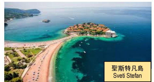
聖斯特凡島 Sveti Stefan

Leave Podgorica for Budva, a Montenegro city with over 2000 years old. Enroute photo stop at Sveti Stefan, a hotel resort island on the Adriatic coast island, UNESCO Heritage Site. Drive to Budva for city orientation, onto churches, towers and narrow streets filled with souvenir shops. Continue to Kotor, a well preserved medieval town also UNESCO Heritage Site. A brief tour will show you all the places of interest that the city can offer. After the visit we arrive Dubrovnik, Croatia, the pearl of Adriatic for overnight. Octopus salad included in hotel dinner. (B/D)