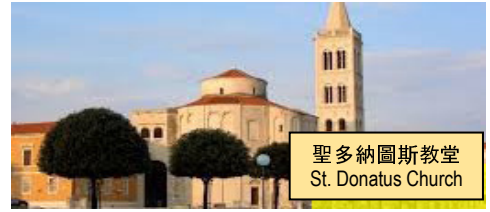
聖多納圖斯教堂 St. Donatus Church

The morning city tour will take you to the St. Donatus Church, the most monumental church in the eastern Adriatic and Croatia's largest pre-Romanesque building. Original name was Church of the Holy Trinity but re-dedicated to St Donatus in the 15th century. Visiting the Sea organ is the highlight of the day. It is an architectural sound art object located in Zadar and an experimental musical instrument, which plays music by way of sea waves and tubes located underneath a set of large marble steps. Afterwards, coach to the Opatija. (B/D)