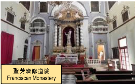
聖芳濟修道院 Franciscan Monastery

住宿：City Hotel 或同級 (早、晚餐) The morning tour will take you to the Franciscan Monastery which houses the oldest pharmacy shop in Europe, and the Rectors Palace. Pass through the Pile Gate to Placa in the Old Town and enjoy a magnificent view of the city from a tower. Afterwards, coach to Mostar, a Bosnia town in the medieval time for overnight. Typical dinner with Cevapcici at hotel. (B/D)