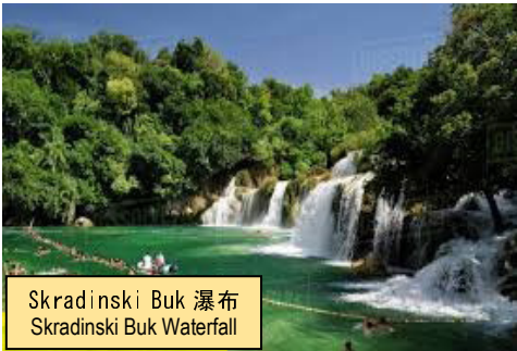
Skradinski Buk 瀑布 Skradinski Buk Waterfall

自助式早餐後，驅車前往 克爾卡河畔之國家公園 。園中分兩部，北面有一木製小徑，漫步周邊，可從不同角度欣賞瀑布、和遠眺 克爾卡修道院、聖母方濟教堂 。南部正是著名的 Skradinski Buk 瀑布 ，因寬度最大，其氣勢絕對令人驚嘆！遊人亦可下水暢泳，沉醉於大自然中。遊畢，乘車至希貝尼克。市內之 聖詹姆斯大教堂 是文藝復興時期建築的代表，最特別是教堂外牆的 71 個人頭浮雕，惟妙惟肖。安排拍照，捕捉其各異表情。繼後自由活動，再次留連在各大街小巷中，追思這歷史名城。午餐自備。啟程至札達爾古城，那是達爾馬提亞的前首都。 晚餐提供地道海鮮美食、烤魷魚 。 住宿：Hotel Pinija 或同級 (早、晚餐) Krka National Park stands on the banks of the Krka River, known for a series of waterfalls. Walking northbound will lead you around the most amazing viewpoints and historic sites. To the south, Skradinski Buk waterfall is the most attractive part of the park. Best of all, it is possible to swim under the waterfall and enjoy nature. Continue to Sibenik and make photo stop at St. James Cathedral, which was decorated with 71 sculpted faces, also the most important architectural monument of the Renaissance. Later on, proceed to Zadar for overnight. Evening dinner with grilled squids. (B/D)